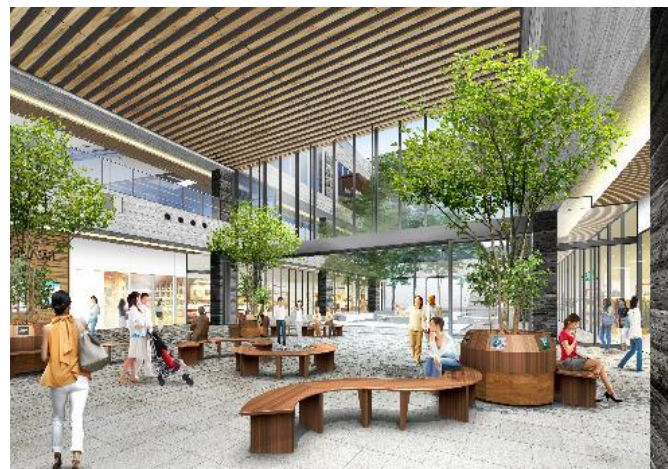
パブリックスペースとなるアトリウムイメージ