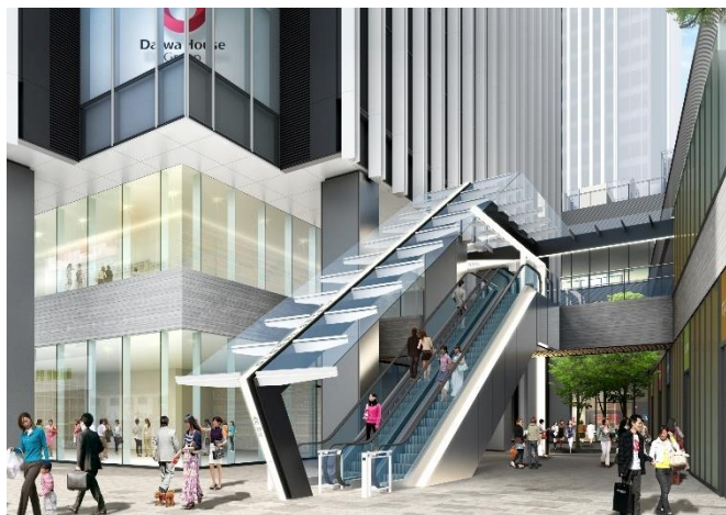
建物東側入口のウェルカムプラザのイメージ

また、東区泉にある食品のセレクトショップ「ナゴヤキッチン エ ビオ グローバルゲート」が、名古屋で人気の「Amelie（アメリ）」と「TRUNK COFFEE STAND（トランク コーヒー スタンド）」と共にグロッサリー&カフェを出店します。その他にも明治21年創業、西尾市の抹茶の老舗「あいや」が運営する抹茶スイーツの専門店「西条園抹茶カフェ」、グローバルゲート限定メニューも豊富なハワイで人気の「Yummy（ヤミー）」など、テイクアウト・イートインにもご利用いただける、さまざまなニーズに合わせた飲食店と、ゴルフ・スポーツサイクル・アウトドアショップから構成されます。名古屋初出店となるオフィスワーカーのライフスタイルに対応した新しいコンビニエンスストア「ファミマ!!」やドラッグストアに加え、トヨタ自動車による運転の魅力を発信するスポットなど、利便性を高めながら、地域カルチャーの発信と「都心生活者が求める上質な生活シーン」を提供します。